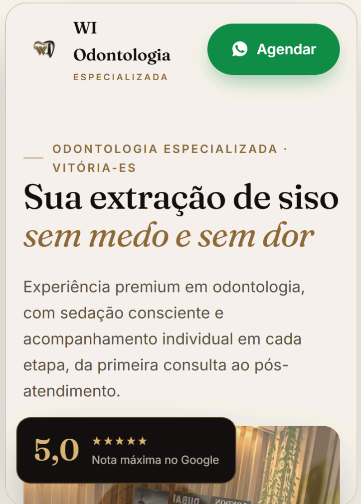
DEPOIS Nova versao